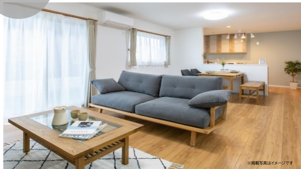
※掲載写真はイメージです